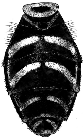
图 30 土斑长角蚜蝇 Chrysotoxum vernale Loew ♂ 腹部 (背面观) (abdomen in dorsal view)

雄性 头顶三角小，黑色，被同色短毛；额亮黑色，沿眼缘覆黄色粉被；颜黄色，具亮黑色中纵条和侧条，毛黄色。复眼被淡色短毛。触角黑色，第3节明显短于基部两节之和；芒黄褐色，与触角第3节等长。中胸背板亮黑色，正中具1对灰色粉被中条，两侧具宽的黄色纵条，纵条在盾沟中部之后中断，背板毛黄褐色；侧板黑色，具3对黄斑，分别位于前胸侧片、中侧片和腹侧片上；小盾片黄色，具大的黑色中斑，被黑色长毛。腹部亮黑色；第2-5节具较窄的中部中断的黄色弓形横带，第2-4节后缘黄色极窄，第5节后缘横带略宽；腹部毛极短。足红黄色，基节、转节及腿节基部黑色。翅略呈黄色，前缘黄至黄褐色。